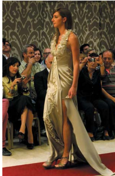
7 giugno 2012