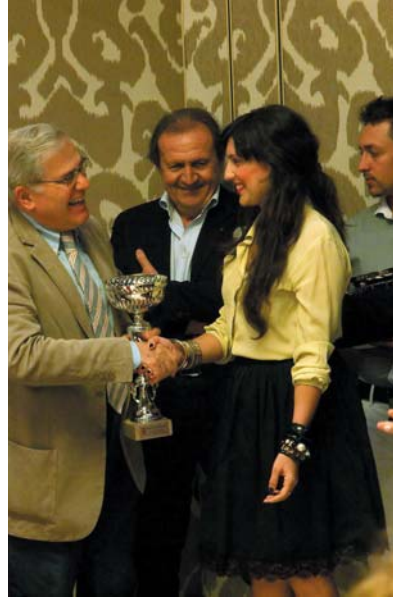
7 giugno 2012