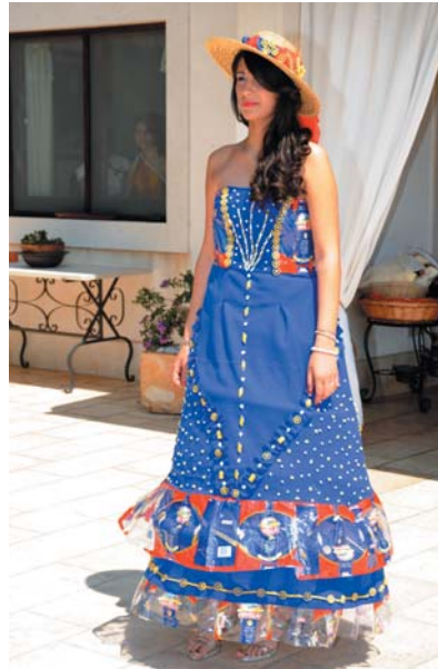
28 maggio 2011