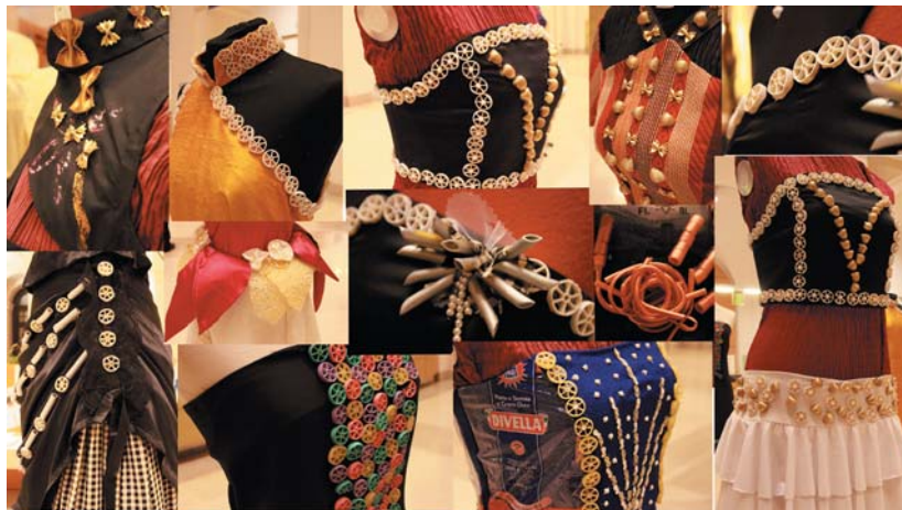
Laboratorio "Moda e Industria" - I.P.S.I.A. "L. Santarella" di Bari. Particolari degli abiti decorati con pasta Divella.